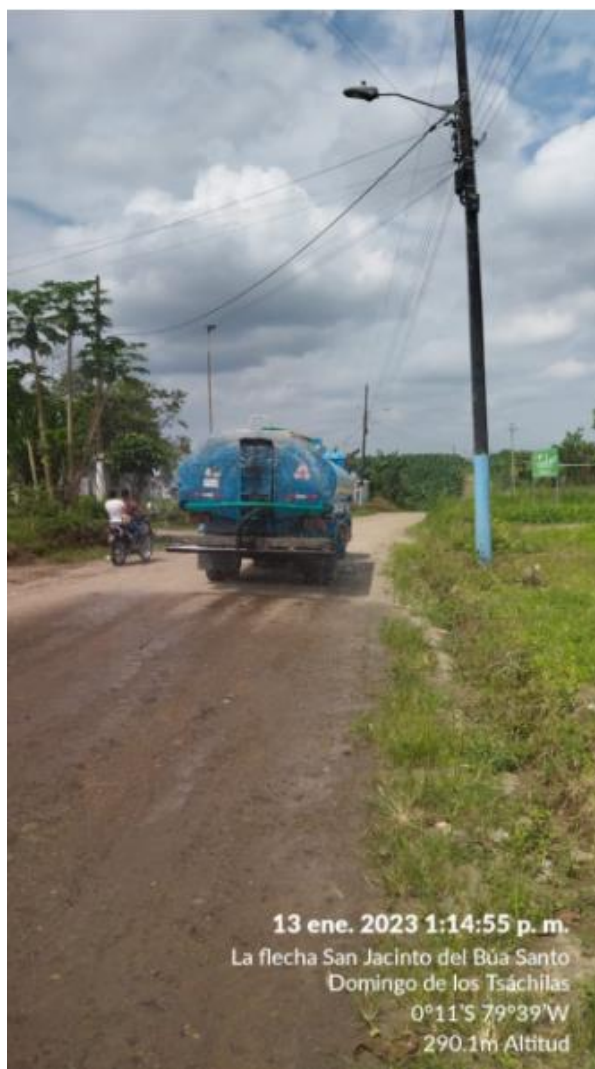
13 ene. 2023 1:14:55 p. m. La flecha San Jacinto del Búa Santo Domingo de los Tsáchilas 0°11'S 79°39'W 290.1m Altitud