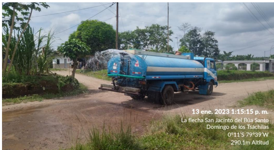
13 ene. 2023 1:15:15 p. m. La flecha San Jacinto del Búa Santo Domingo de los Tsáchilas 0°11'S 79°39'W 290.1m Altitud